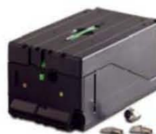
kazeta se zámkem