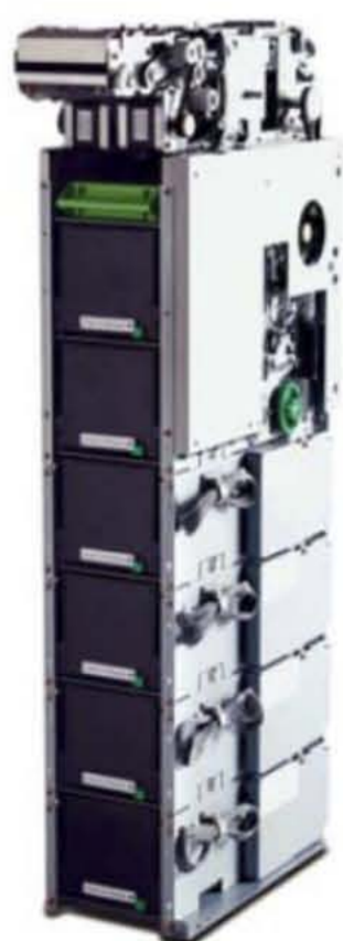
F56 max. rozšířením

Fujitsu F56 Vám poskytne maximální flexibilitu v návrhu finálního výrobku. Může být instalován a nakonfigurován s předním nebo zadním servisním přístupem.