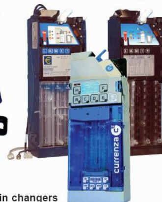
NRI coin changers