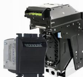
CashCode bill validators